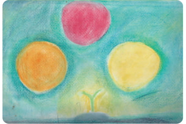
4年生エポックノート 古事記「国生み」より～アメノミナカヌシ、タカミスビ、カミスビの三神～